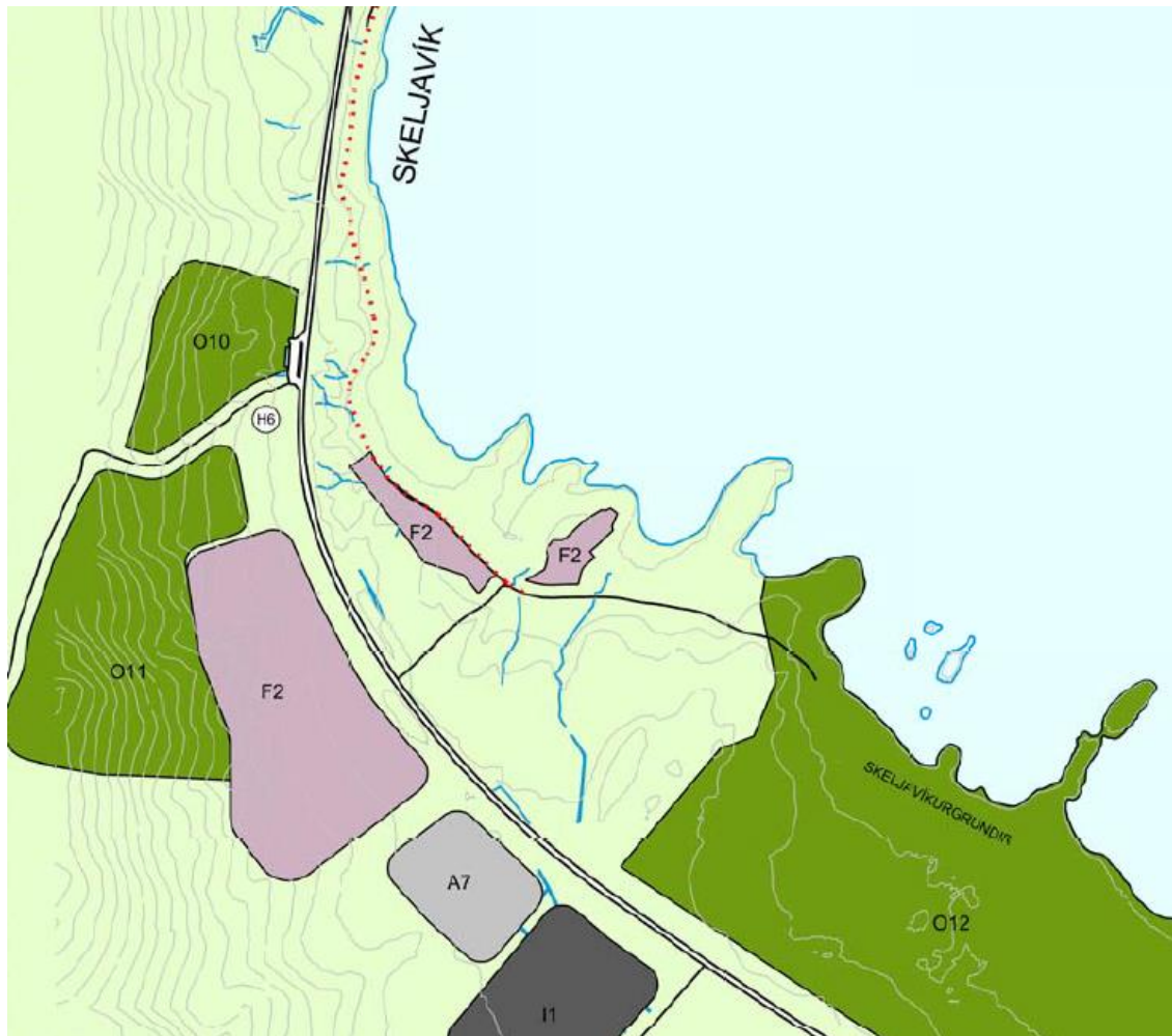
Hluti af aðalskipulagsupprætti fyrir þéttbýlið á Hólmavík

Sveitarstjórn Strandabyggðar hefur ákveðið að vinna deiliskipulag fyrir frístundabyggð við Skeljavík.